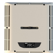
Consola interior con pantalla táctil. Led ambiental regulable en intensidad.